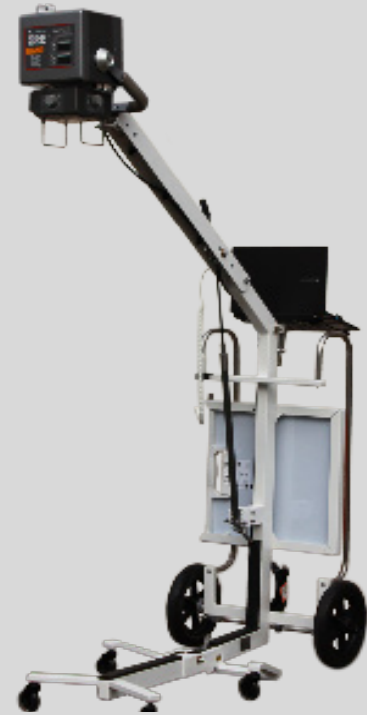
Una vez desplegado, está listo para tomar radiografías.

Diseño Fácil de Usar | Flujo de trabajo Sencillo y Rápido | Función de Diagnóstico Ágil